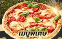
เมนูพิเศษ Pizza Margherita

เดินทาง 3 - 10 / 7 - 14 / 17 - 24 เม.ย. 67